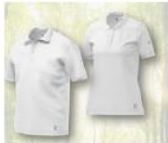
Erste BP® Circular Artikel