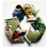
40 % aller BP® Stoffe haben einen Recycling-Anteil