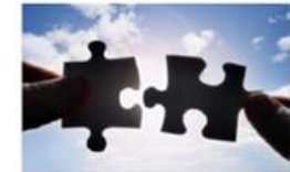
Erste Kooperationen bei Circular-Projekten