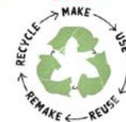
Mindestens 50% der BP® Produkte sind recycelbar