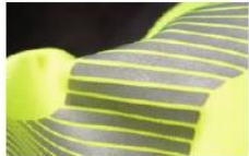
Reparaturkits für Reflexstreifen